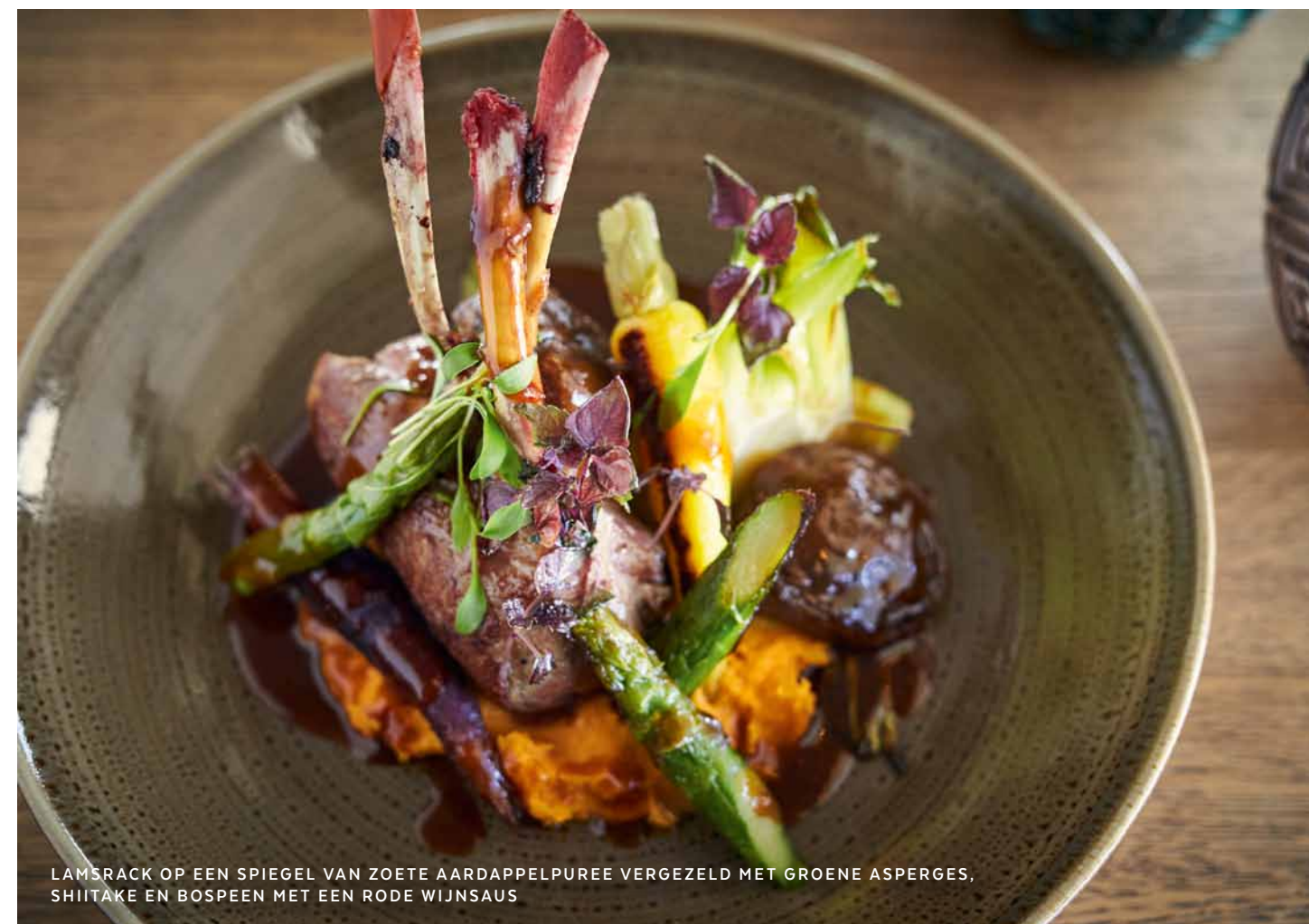
LAMSRACK OP EEN SPIEGEL VAN ZOETE AARDAPPELPUREE VERGEZELD MET GROENE ASPERGES, SHIITAKE EN BOSPEEN MET EEN RODE WIJNSAUS